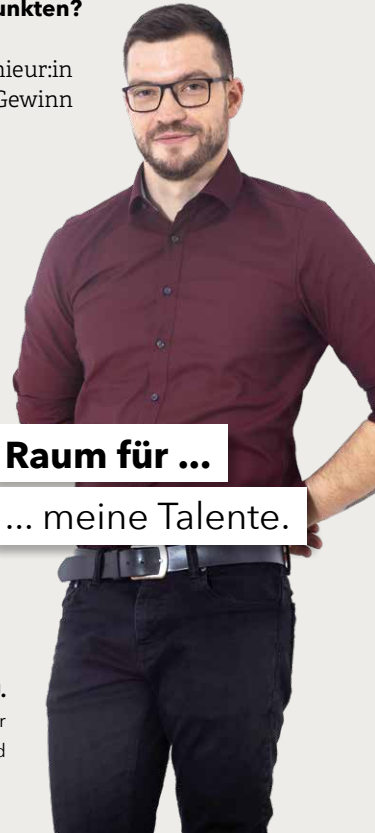
Gion U. Holztechniker Vertrieb Systemwand