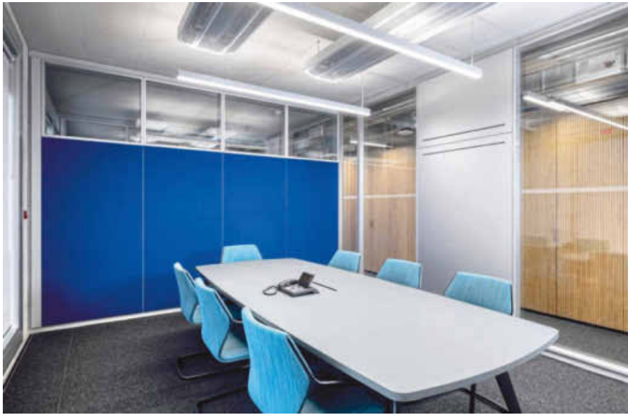
/ Textile Raumtrennung: Mit Objektstoffen gestaltete Vollwandpaneele tragen wesentlich zu einer funktionierenden Raumakustik bei.

sind jeweils flurseitig bündig als Holztürelemente Fecotür H70 oder Alurahmen-Glastüren Fecotür A70 ausgeführt. Beide Lösungen bieten Schallschutzklasse 2, R_{w,p} = 37 dB. Holztüren und Vollwandoberteile sind mit Echtaluminiumschichtstoff passend zur E6/EV1 eloxierten Profiloberfläche Aluminiumsilber belegt. Die Bürozwischenwände vermitteln mit der Fecofix-Oberlichtverglasung einen großzügigen Raumeindruck. (hf/Quelle: Feco) ■