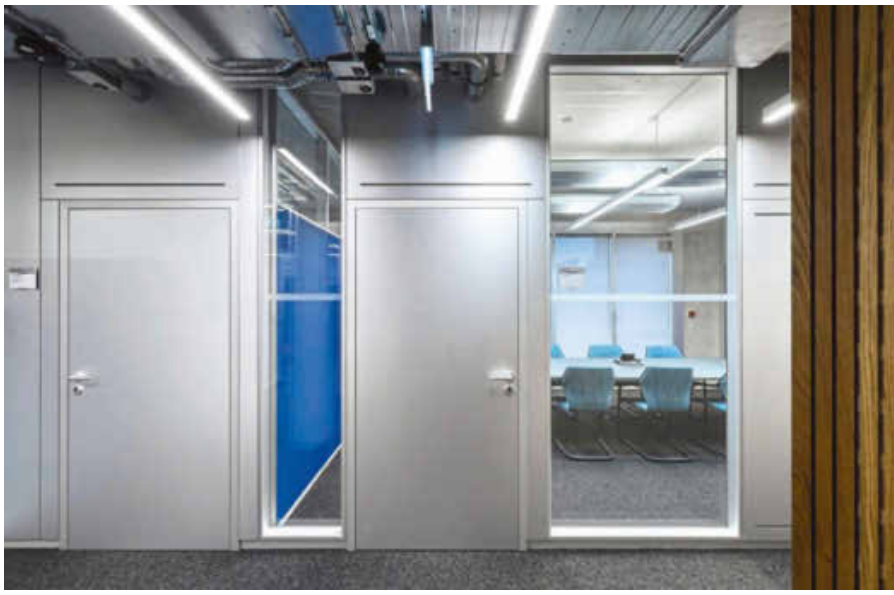
/ Oberflächenoptik aus einem Guss: Holztüren und Vollwandoberteile sind passend zu den E6/EV1 eloxierten Rahmenprofilen mit Aluminiumschichtstoff belegt.