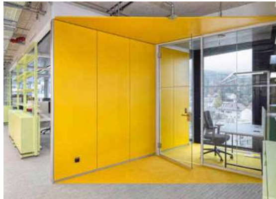
Die Seekiefer-Vollwandoberflächen sind mit Wasserlack matt lackiert und unterstützen den Werkstattcharakter

Mit der Nurglaskonstruktion FECOPLAN und der Vollwand FECOWAND wurden Räume für Konzentration zur temporären Nutzung in den offenen Teamflächen geschaffen. Die farbenfroh lackierten Vollwandoberflächen in Blau, Gelb und Violett bieten Orientierung und setzen bunte Akzente. Die Seekieferfurnier-Vollwandoberflächen sind mit Wasserlack matt lackiert und unterstützen den Werkstattcharakter der flexiblen Mittelzonen. Diese Flächen sind mit Schiebewänden und akustisch wirksamen Vorhängen entsprechend den Bedürfnissen nach Platzbedarf sowie akustischer und räumlicher Abschirmung variabel gestaltbar. Im Bereich der Kommunikationsflächen führte Feco Schrankelemente und Einhausungen für