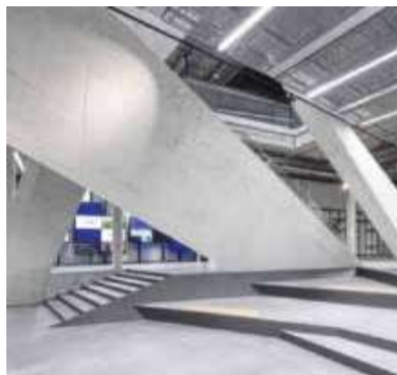
Plateaugeschoss mit Kasino, Restaurant und Konferenzräumen