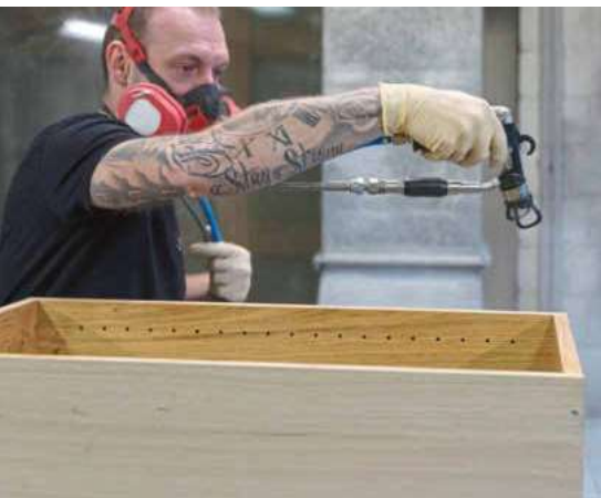
Treftsicher mit Spritzpistole Wie die Tischlerei Funke auch Schmalflächen mit wenig Overspray lackiert.