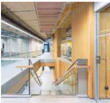
Begegnungsräume mit Werkstattcharakter im Erschließungsbereich des Gebäudes

Das Gebäude mit 330 Arbeitsplätzen wird zum architektonischen und funktionalen Bindeglied bisher baulich getrennter Hörfunk-, Fernseh- und Onlinebereiche. Gleichzeitig ist es ein Bekenntnis des SWR zum Standort Baden-Baden. Finanziert wurde