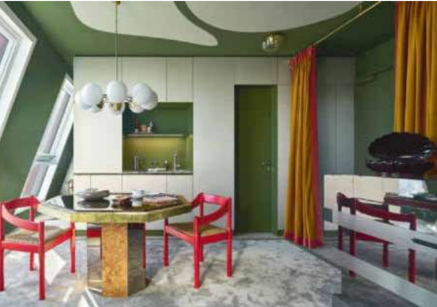
Aus eins mach zehn Zehn deutsche Designbüros gestalten Apartments mit Küchen im Rahmensystem von J*Gast.